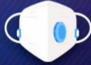
Máscara N95 PFF2